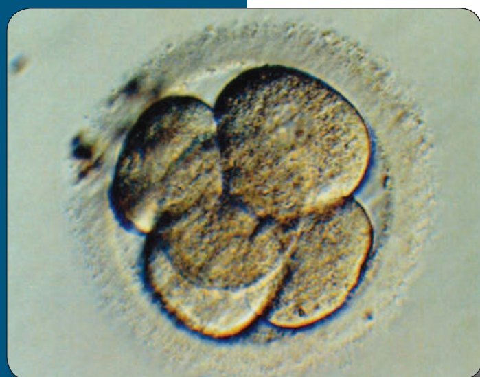
Células de embrión de unos días

Bien, pues, ¿no quiere decir un aborto asesinar a otro ser humano? No, en absoluto.