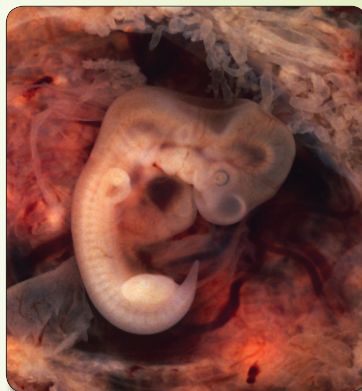
Embrión de 5 semanas

1 Un feto aún no es un ser humano. No es sino una bola de células con el potencial de convertirse en un ser humano. Está “vivo”, pero eso también es cierto en el caso de las otras células en el cuerpo de una mujer. Aún no tiene vida propia. Aún no es una vida separada de la vida de la mujer en cuyo útero se encuentra.