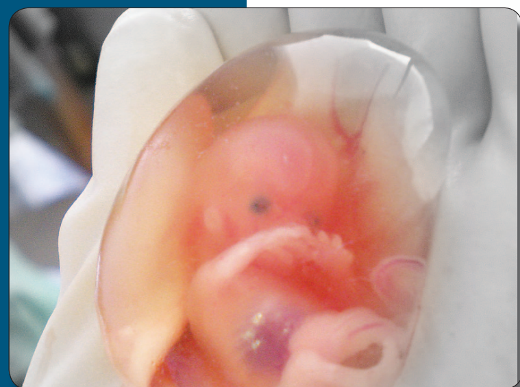
Feto de 10 semanas

2 Los oponentes del aborto llevan grandes letreros con fetos flotando alrededor del útero de una mujer, como si estuvieran totalmente separados de las mujeres. Al contrario de la manera en que estos representan las cosas, un embrión o feto no puede sobrevivir por sí mismo. Este obtiene oxígeno de la sangre de la mujer, excreta residuos a través de la madre... Y esto es así hasta que el bebe nazca. Este no es un ser humano más independiente que cualquier otro órgano o parte del cuerpo de la mujer.