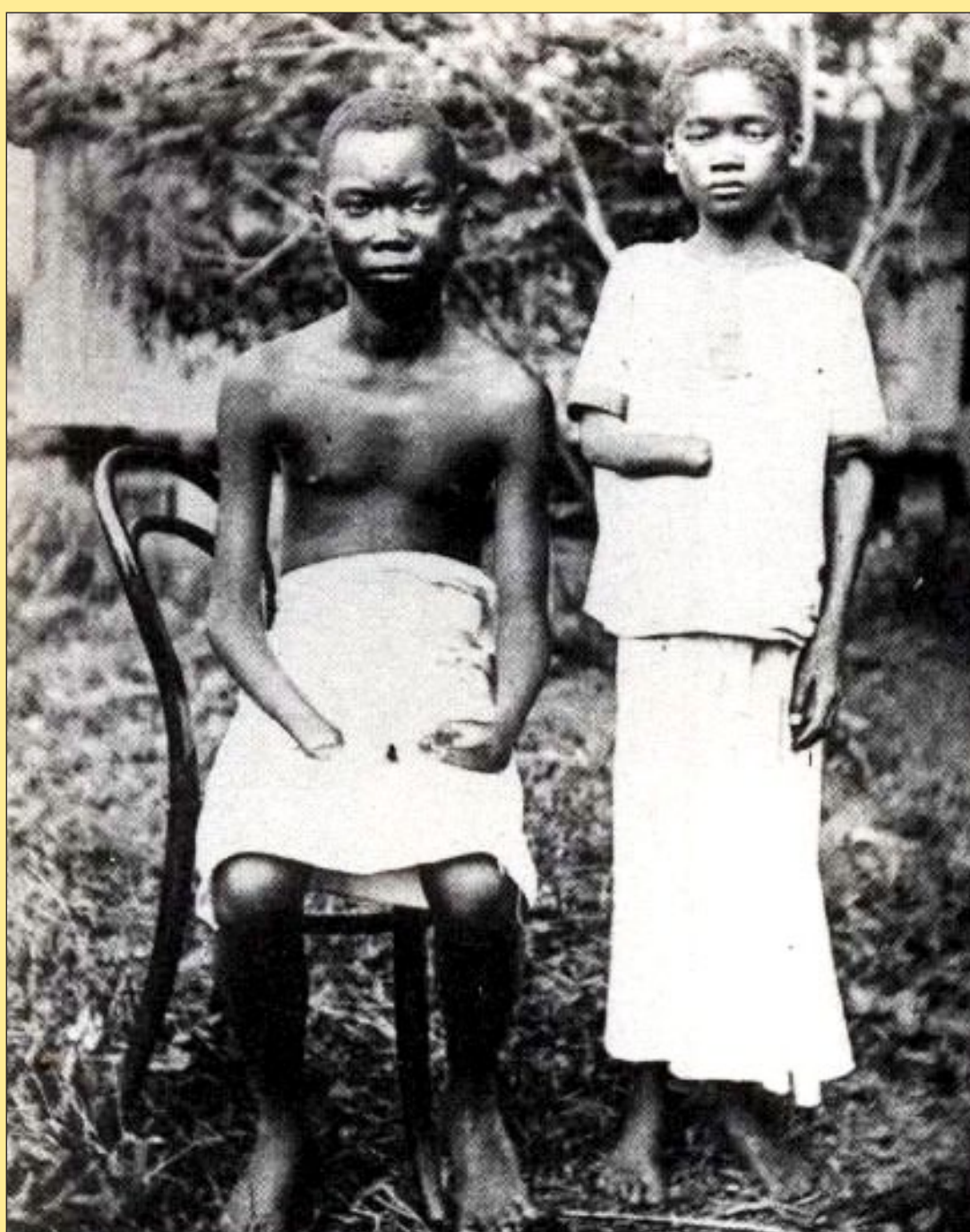
Se mantuvieron de rehenes a sus esposas e hijos, y a menudo les cercenaron las manos, narices y orejas cuando los hombres no lograban alcanzar la cuota de caucho o no volvían.

Finalizando el siglo 19 y a comienzos del 20, el rey Leopoldo II de Bélgica administró el “Estado Libre del Congo” como propiedad privada, amasando una enorme fortuna convirtiendo a la mayoría de los hombres adultos en esclavos para recoger el caucho y marfil de la selva y a su vez mantener de rehenes a sus esposas e hijos. A menudo les cercenaron las manos, narices y orejas cuando los hombres no lograban alcanzar la cuota de caucho o no volvían. Por más de 23 años, el ejército del rey obligó a cientos de miles de esclavos a matarse trabajando. Aplastó a sangre y fuego a unas 20 rebeliones de esclavos. Después de que los belgas en 1903 descubrieron el oro, los obligaron a matarse trabajando en las minas. Se calcula que unos diez millones de personas, de una población de veinte millones, murieron bajo el bárbaro rey Leopoldo.