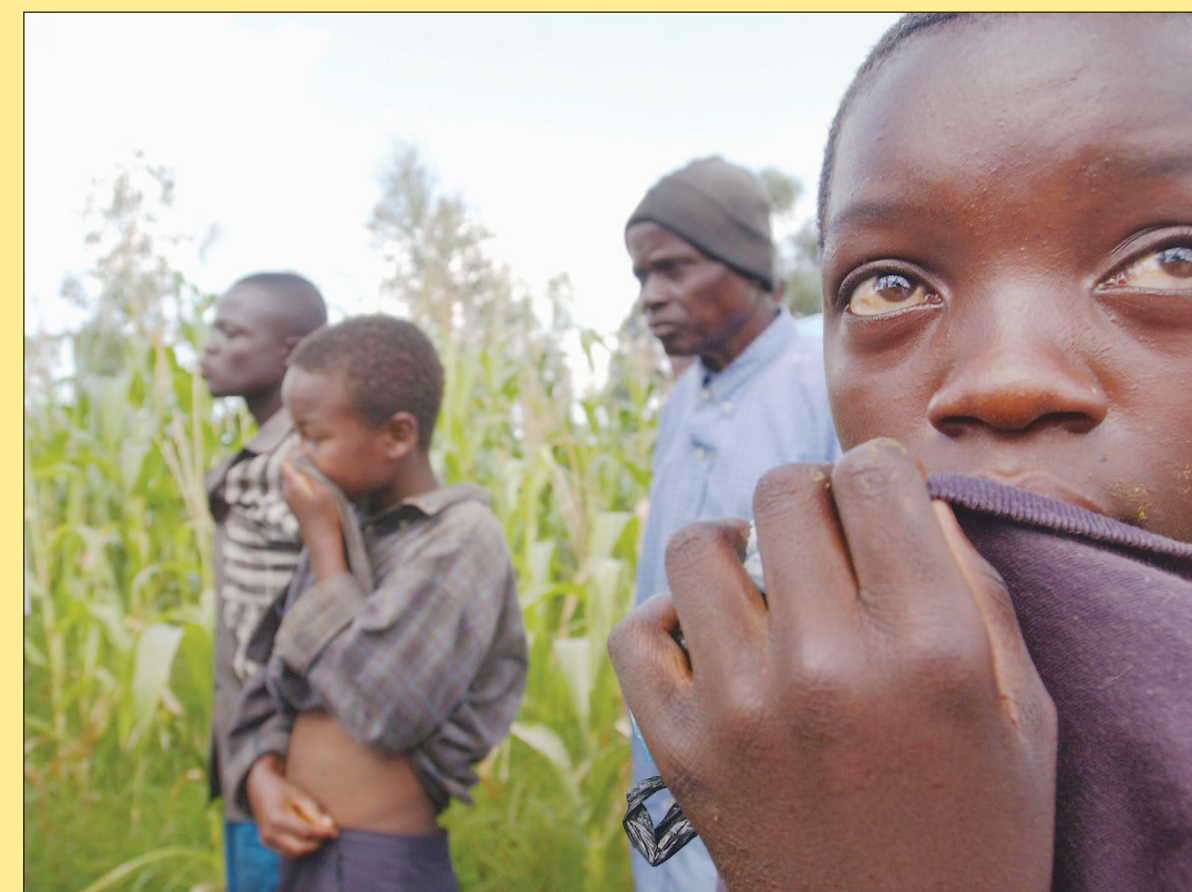
En el entierro de una persona que resultó muerta en los combates entre las milicias rivales, 2003.

Bob Avakian, presidente del Partido Comunista Revolucionario, Estados Unidos