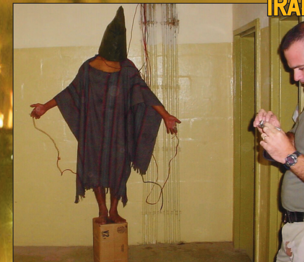
Prisión Abu Ghraib, Irak, 2003 a 2004. Fotos filtradas muestran la tortura y asesinato de prisioneros iraquíes por soldados yanquis.