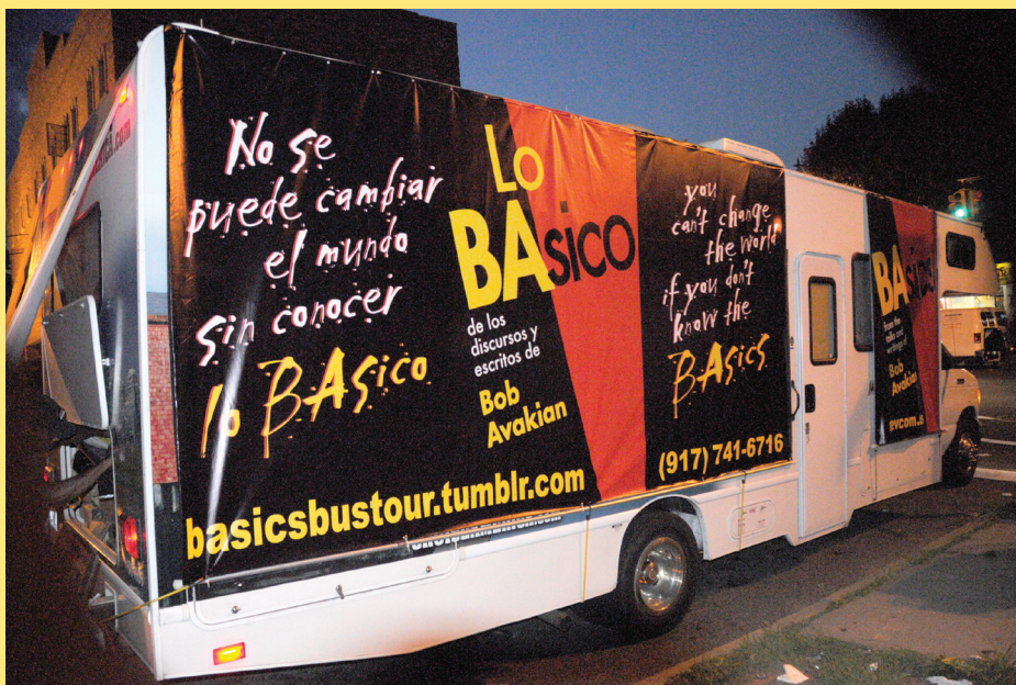
El Autobús Lo BASICO

¡BA EN TODAS PARTES... IMAGÍNESE QUÉ TANTO PUDIERA IMPORTAR! En el camino con la Gira del Autobús Lo BASICO