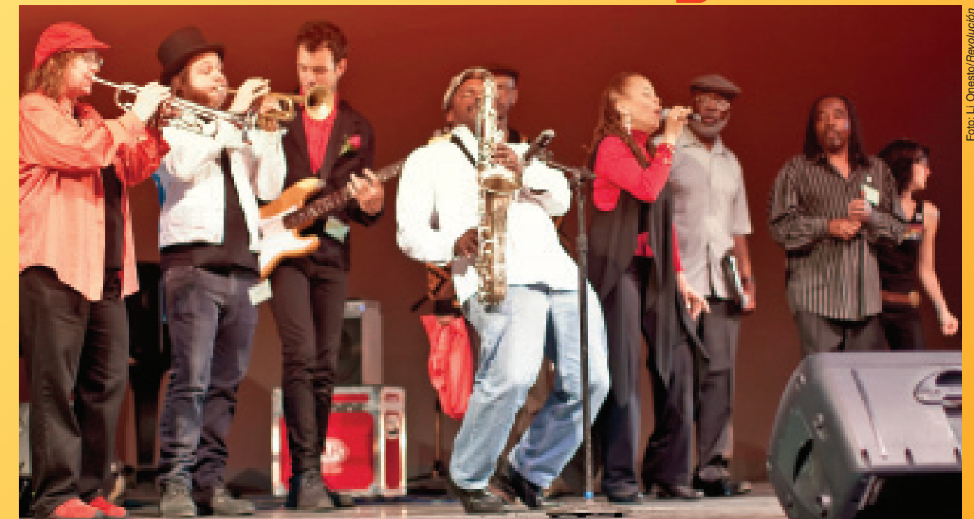
En el escenario de "Con motivo de la publicación de Lo BASICO : Una celebración de revolución y la visión de un mundo nuevo," 11 de abril de 2011.

BA en Todas Partes ha vibrado con una cultura radical: la participación de poetas estudiantes, raperos y músicos... de los parques y esquinas hasta los teatros y clubes de jazz. En 2013 es necesario llevarla a nuevas alturas, con nuevas formas para documentar la relación especial entre Bob Avakian y las voces de los de abajo que están lidiando con las cuestiones más grandes de la revolución. Manténgase sintonizado para las noticias sobre el estreno de la película sobre una velada muy importante celebrada en la primera de 2011, Con motivo de la publicación de Lo BASICO: Una celebración de revolución y la visión de un mundo nuevo .