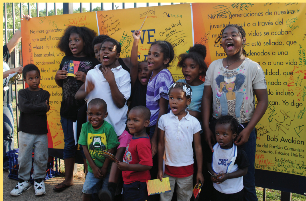
Con la Gira del Autobús Lo BASICO, Atlanta, Georgia, 2012.

La dinámica columna vertebral de esta campaña ha sido el movimiento que ha comenzado por el país para popularizar la obra de BA por toda la sociedad y recaudar los fondos para hacerlo. Miles de personas han participado en la distribución de las tarjetas con las citas de Lo BASICO ... plantando un polo radicalmente diferente en la sociedad y haciéndolo de maneras que faciliten que las personas participen en la misma dondequiera que estén. En el proceso, la obra de BA se ha conectado con las personas que luchan contra el poder, como las protestas contra los asesinatos policiales en Nueva York, Anaheim, Chicago, Cleveland y otras partes. Desde todo el país, las personas han enviado sus comentarios sobre estas citas, adentrándose en la obra de BA y así, comunicándose entre sí. Muchos miles de personas han visto los videos de BA en línea acerca de una amplia gama de cuestiones candentes.