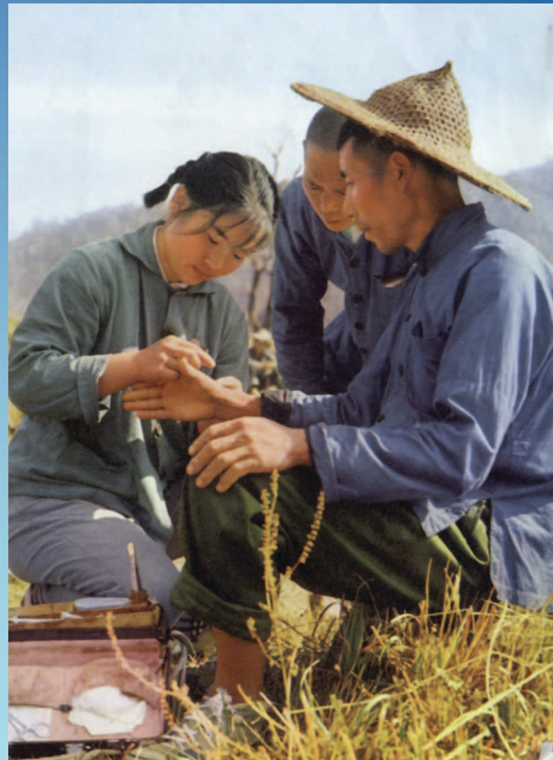
China, 1971: Una médica descalza lleva cuidados médicos al campo.