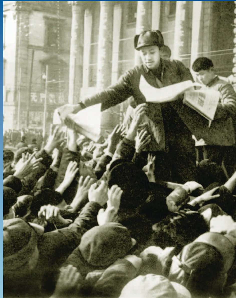
Shanghái, China, 1967: La distribución de literatura revolucionaria durante la Tempestad de Enero.