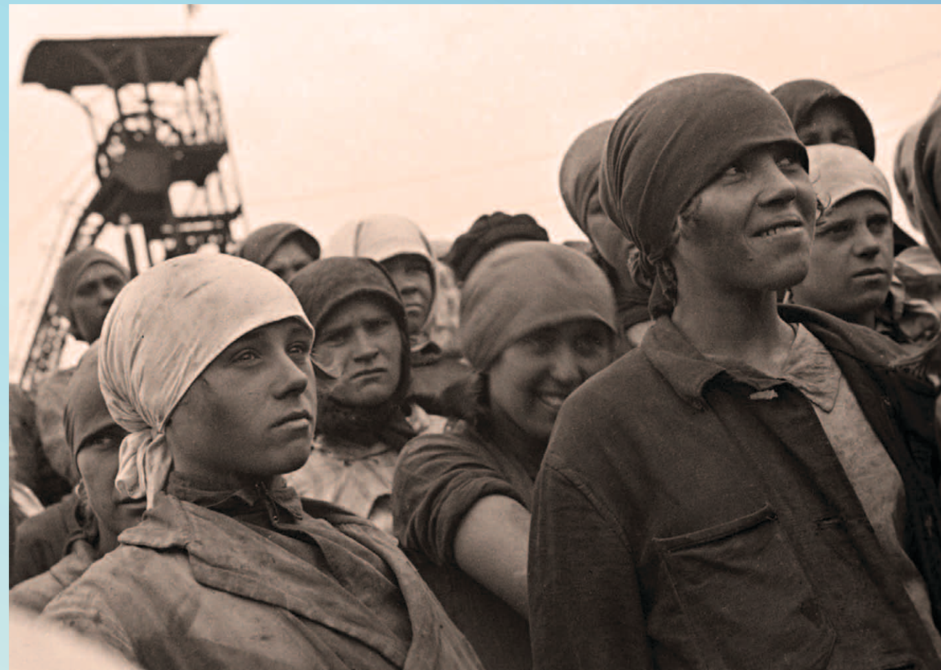
Unión Soviética, 1930: Unas jóvenes mujeres, del grupo de jóvenes comunistas Komsomol, se ofrecen de voluntarias para trabajar en las minas.