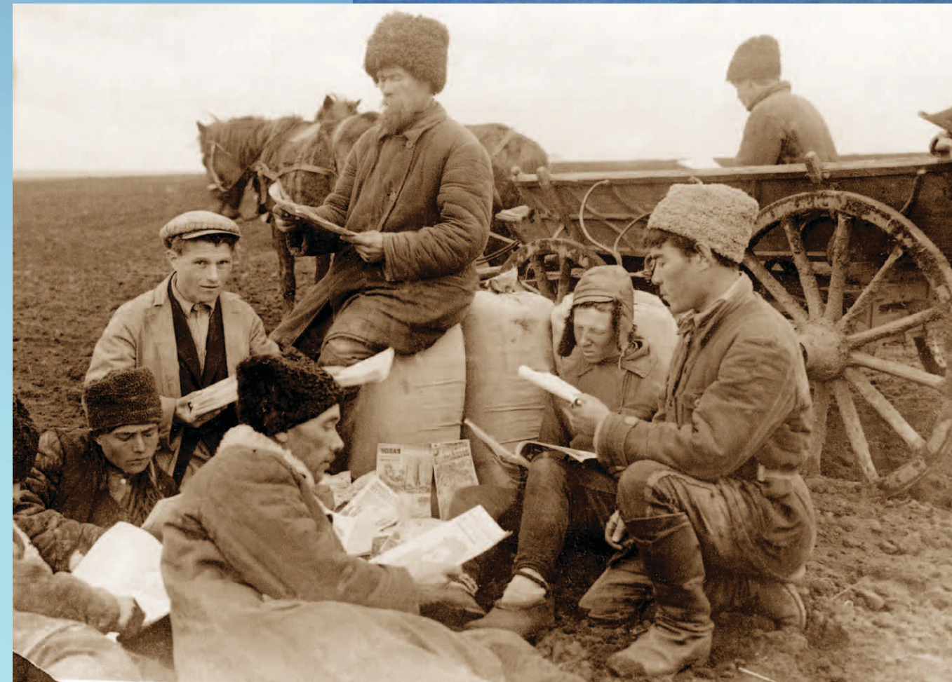
Unión Soviética, 1930: En una campaña para eliminar el analfabetismo entre los campesinos, el gobierno envió millones de libros, periódicos y revistas al campo.