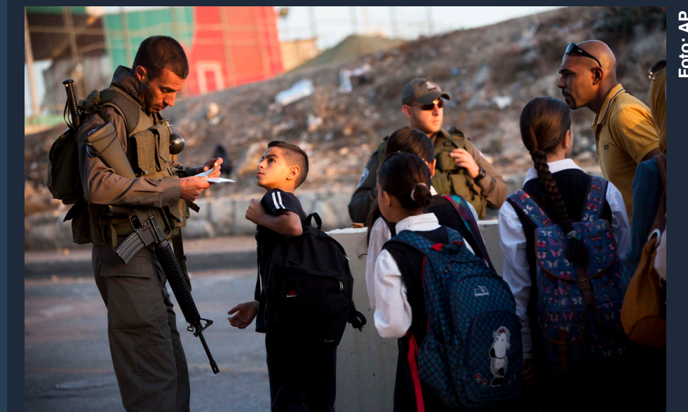
2015. La policía fronteriza israelí revisa los carnés de niños palestinos en un rehén en Jerusalén.