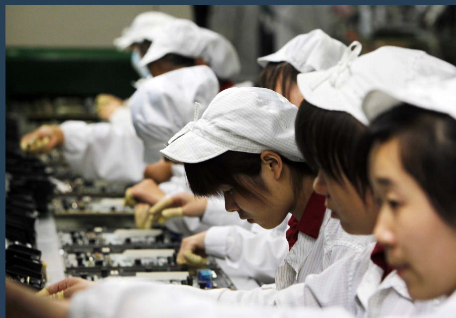
2010. Trabajadoras fabrican iPhones y iPads en el complejo de Foxconn en Shénzhen, China.