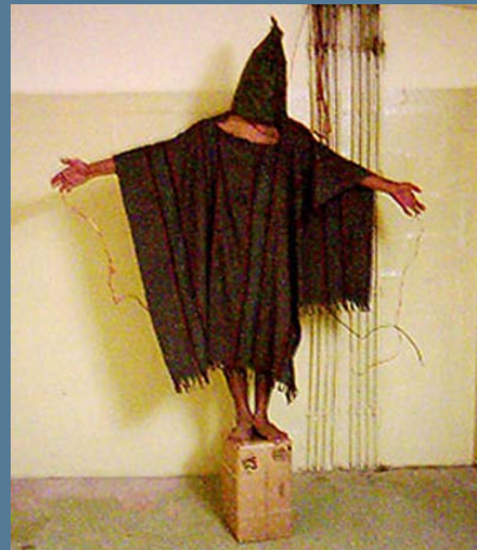
2003. La CIA y tropas estadounidenses en Irak torturan a presos en Abu Ghraib.