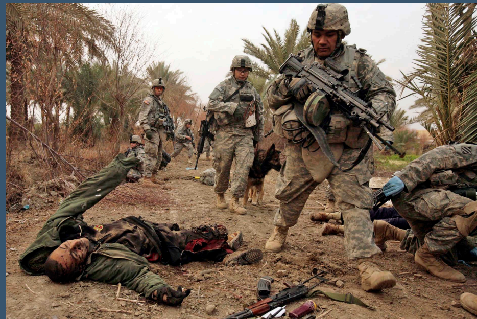
2008. Tropas estadounidenses pasan por el cadáver de una persona muerta por un ataque de helicóptero en Arab Jabour al sur de Bagdad, Irak.