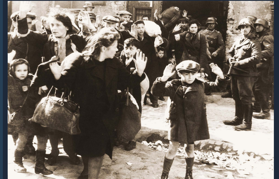
1943. Tropas alemanas acorralan a judíos después del levantamiento en los guetos de Varsovia, Polonia.