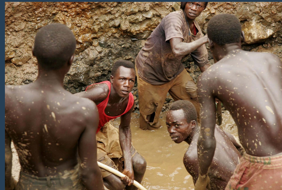
2006. Mineros de oro en Ika Barrier, República Democrática del Congo.