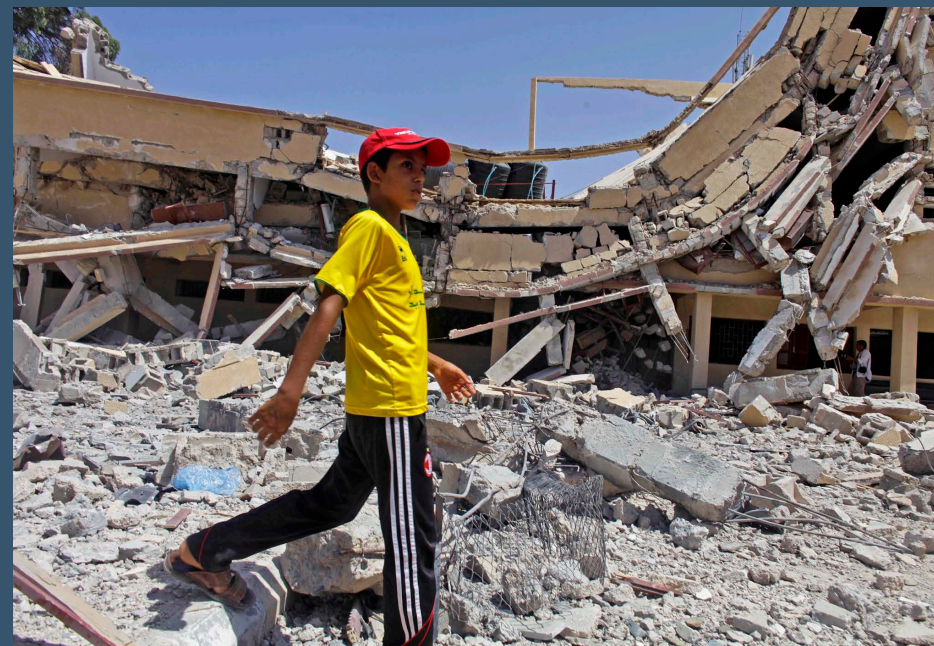
Ataques aéreos de la OTAN destruyeron este edificio de una universidad en Zlitan, Libia.