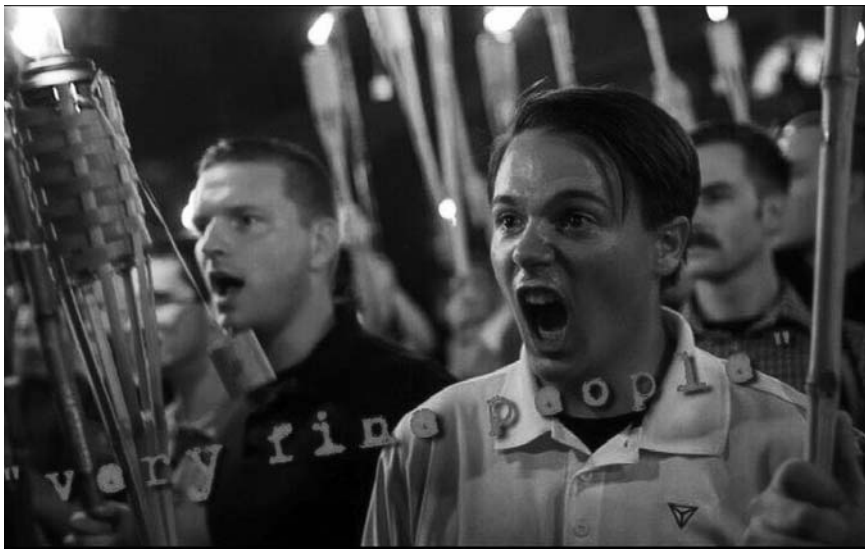
Fascistas y supremacistas blancos marchan en Charlottesville, Virginia, agosto de 2017. Trump los llamó “muy buena gente”.

(Si piensas que se trata de una exageración —que es muy extremo calificar así a Trump— pues aún no sabes quién es realmente Donald Trump. Mantente en sintonía para la Sexta parte: más evidencia de que Donald Trump es un racista genocida).