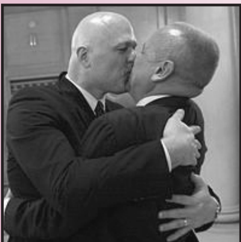
Dos hombres recién casados