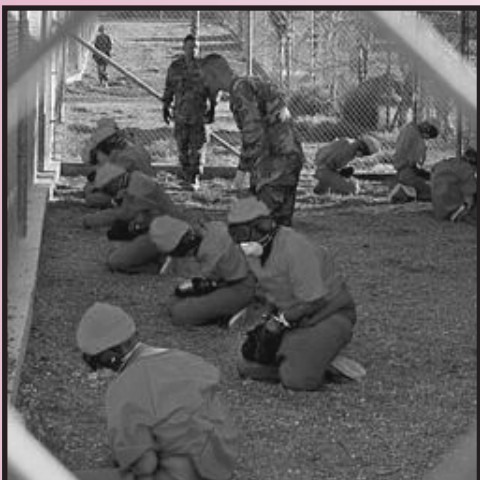
Tortura de prisioneros en Guantánamo