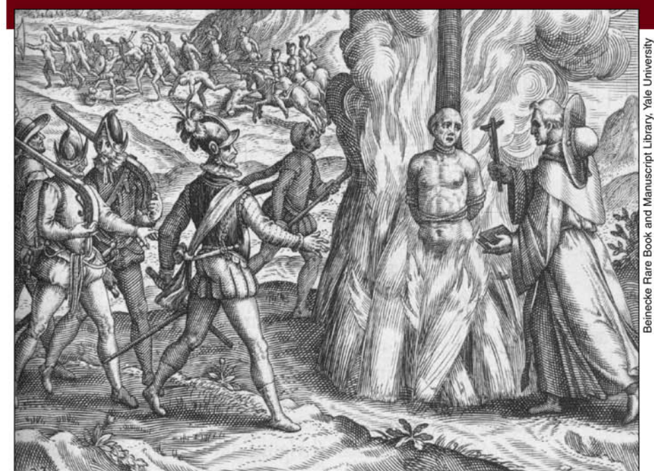
Campaña española de genocidio contra la población de Hispaniola (hoy Haití y la República Dominicana), ilustrada por Fray Bartolomé de las Casas.

1 El “descubrimiento” de lo que se llamaría las Américas aceleró el desarrollo del capitalismo en Europa. A los indígenas que sobrevivieron los ejércitos y las enfermedades de los europeos los enteraron vivos en las minas donde sacaron el oro y la plata que alimentaron los albores del capitalismo en Europa. Después explotaron a los esclavos africanos en las plantaciones y minas del “nuevo mundo”. Carlos Marx escribió en El capital : “Bajo el sistema colonial, prosperaban como planta de estufa el comercio y la navegación. Las ‘Sociedades Monopolias’ (Lutero) eran poderosas palancas de concentración de capitales. Las colonias brindaban a las nuevas manufacturas, que brotaban por todas partes, mercado para sus productos y una acumulación de capital intensificada gracias al régimen de monopolio. El botín conquistado fuera de Europa mediante el saqueo descarado, la esclavización y la matanza refluían a la metrópoli para convertirse aquí en capital”.