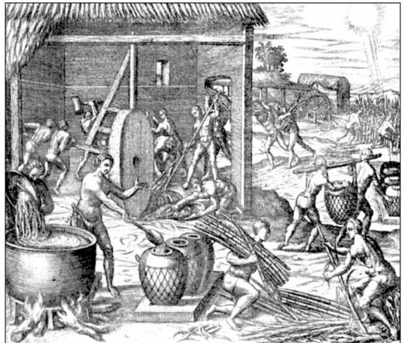
Esclavos del nuevo mundo producen azúcar para exportación a Europa, de Historia Antipodum, un libro del siglo 17.