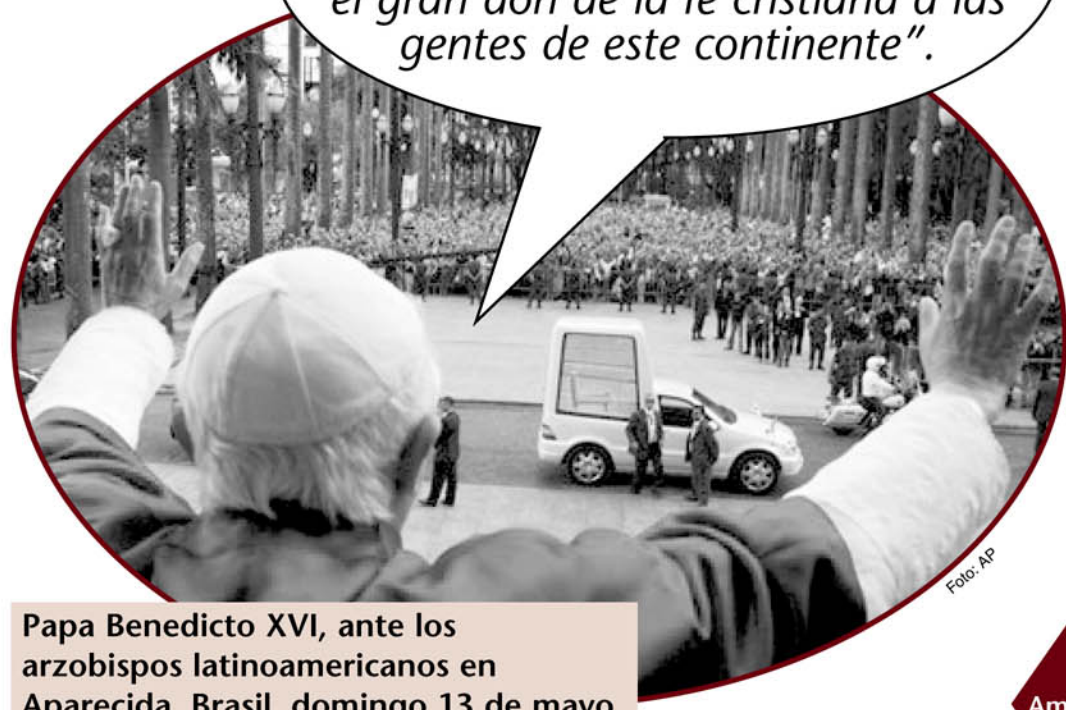
Papa Benedicto XVI, ante los arzobispos latinoamericanos en Aparecida, Brasil, domingo 13 de mayo de 2007.

“Quiero que mis primeras palabras sean de acción de gracias y de alabanza a Dios por el gran don de la fe cristiana a las gentes de este continente”.