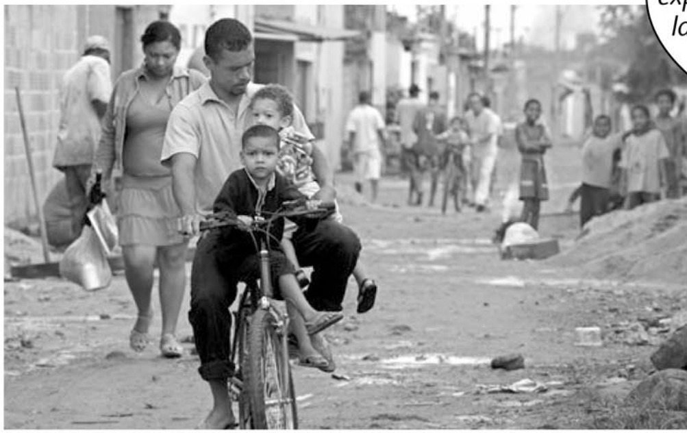
A 10 millas de Brasilia, la capital brasileña, el tugurio Estructural tiene calles de tierra y alcantarillas abiertas.

4 La “gran sintonía” aportada por la “cultura cristiana” (como ingrediente de la esclavitud del capitalismo) se manifiesta hoy en las favelas, en los campesinos sin tierra y en la desigualdad y opresión que marca hoy a América Latina.