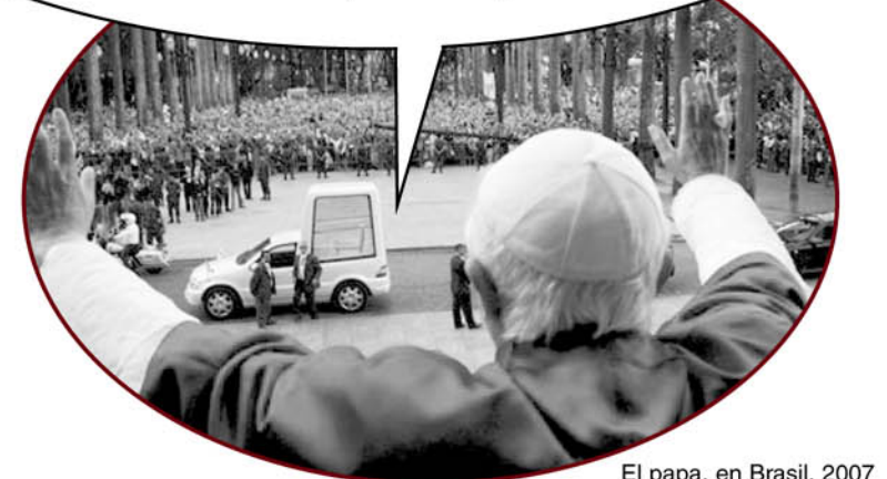
El papa, en Brasil, 2007

“La fe en Dios ha animado la vida y la cultura de estos pueblos durante más de cinco siglos. Del encuentro de esa fe con las etnias originarias ha nacido la rica cultura cristiana de este continente expresada en el arte, la música, la literatura y, sobre todo, en las tradiciones religiosas y en la idiosincrasia de sus gentes, unidas por una misma historia y un mismo credo, y formando una gran sintonía en la diversidad de culturas y de lenguas”.