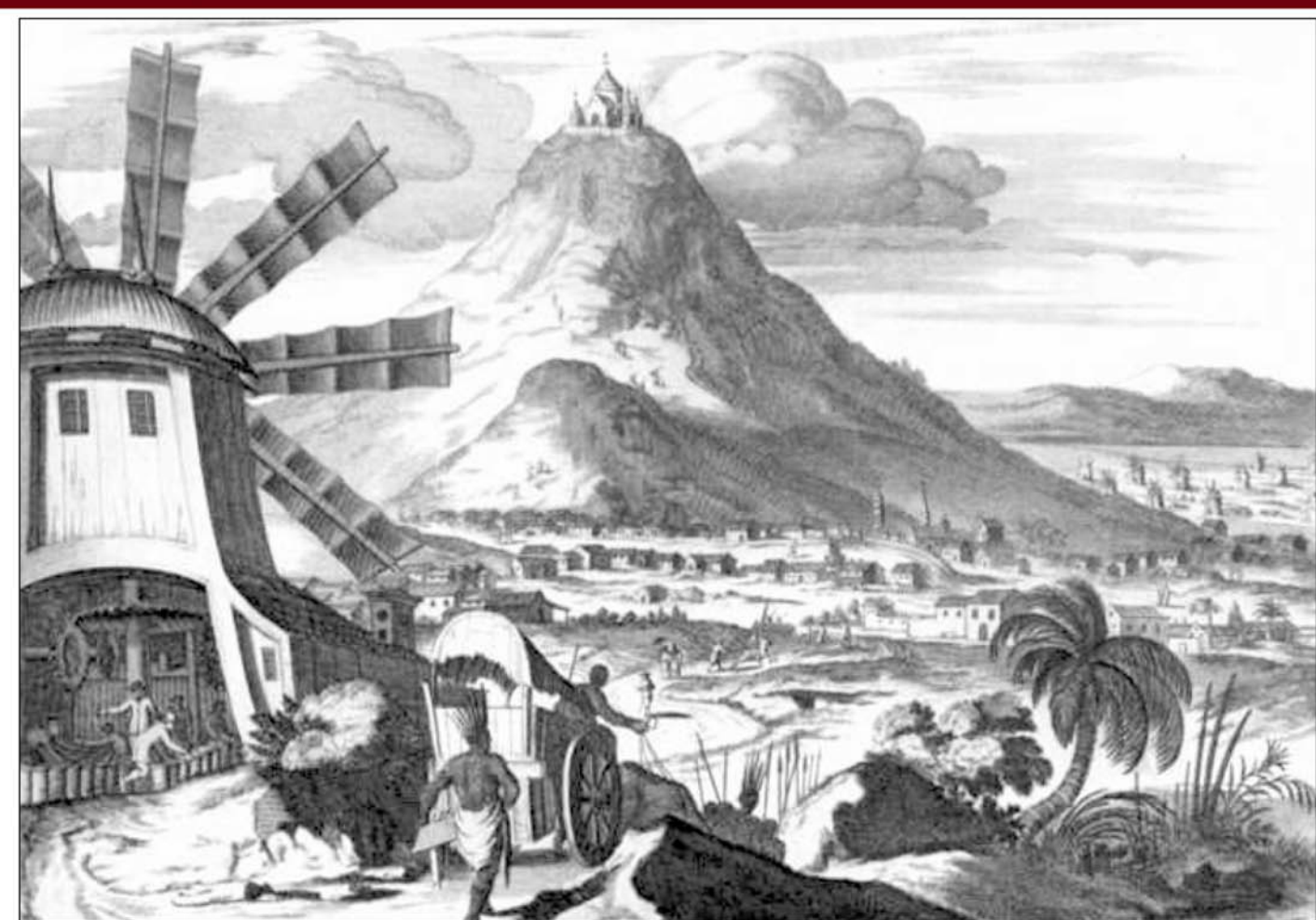
La mina de plata de Potosí, Bolivia, de un grabado del siglo 17.

1 El “descubrimiento” de lo que se llamaría las Américas aceleró el desarrollo del capitalismo en Europa. A los indígenas que sobrevivieron los ejércitos y las enfermedades de los europeos los enteraron vivos en las minas donde sacaron el oro y la plata que alimentaron los albores del capitalismo en Europa. Después explotaron a los esclavos africanos en las plantaciones y minas del “nuevo mundo”. Carlos Marx escribió en El capital : “Bajo el sistema colonial, prosperaban como planta de estufa el comercio y la navegación. Las ‘Sociedades Monopolias’ (Lutero) eran poderosas palancas de concentración de capitales. Las colonias brindaban a las nuevas manufacturas, que brotaban por todas partes, mercado para sus productos y una acumulación de capital intensificada gracias al régimen de monopolio. El botín conquistado fuera de Europa mediante el saqueo descarado, la esclavización y la matanza refluían a la metrópoli para convertirse aquí en capital”.