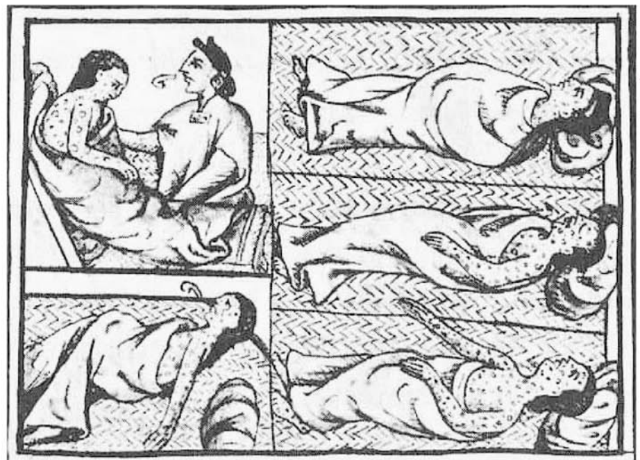
Aztecas mueren de viruela (dibujo azteca transcrito por el Fray Sahagún, “El Códice Florentino”).

2 El cristianismo llegó al “nuevo mundo” como arma de conquista. Apuntalados por las armas de fuego y las espadas, los misioneros cristianos establecieron sistemas que pusieron a la organización de las comunidades indígenas existentes al servicio de la explotación del capital europeo.