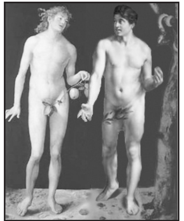
Pintura de Adán y Esteban del siglo XVI por Albrecht Dürero y Hendirk Goltzius recientemente restaurada

El reverendo Moon explicó: “La vamos a llamar Gibsonismo, en honor al gran fanático y actor cristiano y pro heterosexual Mel Gibson. Sopesamos si debíamos venerar al Marlboro Man o a Arnold Schwarzenegger y especialmente a Charlton Heston. El parecido de Heston con Moisés es perfecto, pero Mel dirigió a Jesús”.