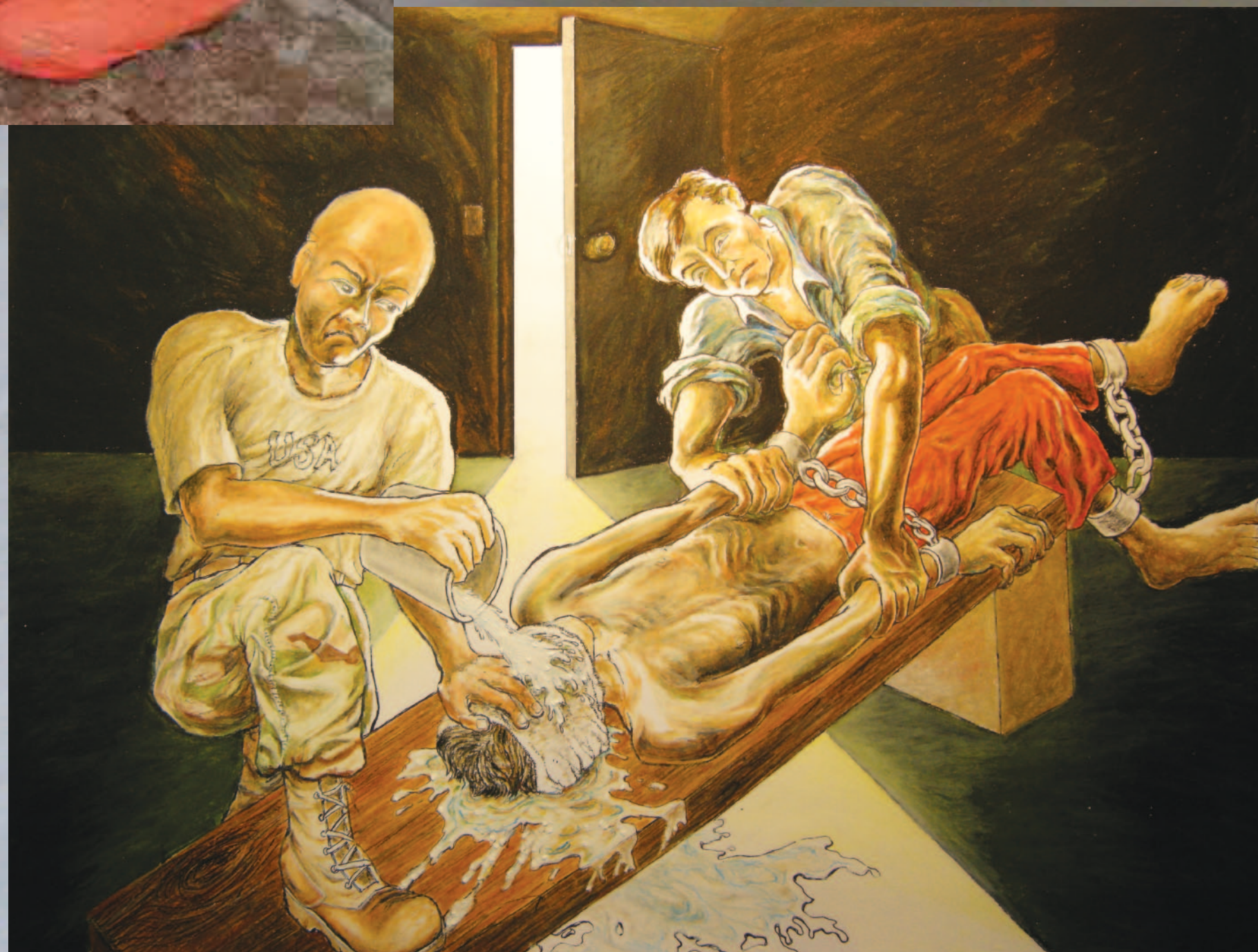
Arriba: Representación del submarino por un artista

Amenazas de matar a los hijos de un detenido... Amenazas de abuso sexual contra familiares femeninos de un detenido... Aplicar el submarino de formas que violaron muchísimo las normas aprobadas por la Consejería Jurídica de la Casa Blanca de Bush con sus “memos de tortura”... Un informe de 2004 recién divulgado, de la Oficina del Inspector General de la CIA, documenta éstos y otros ultrajes nuevos.