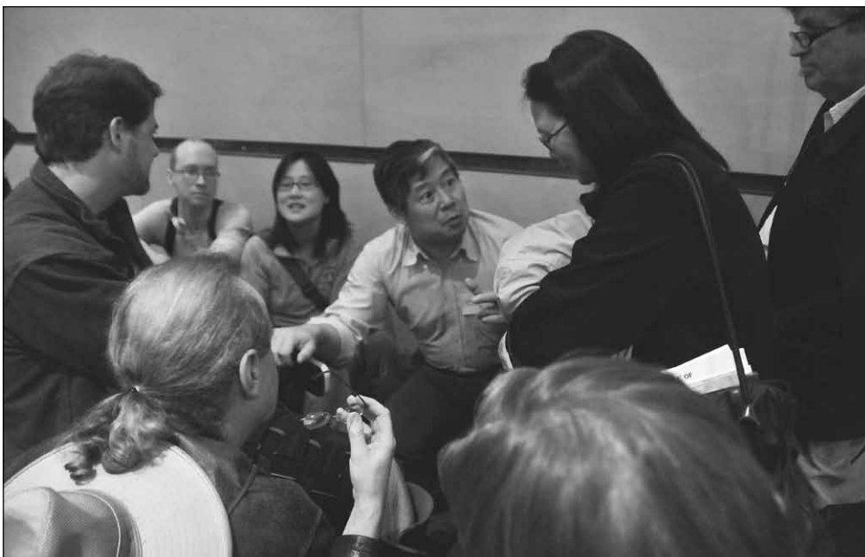
Especial para Revolución