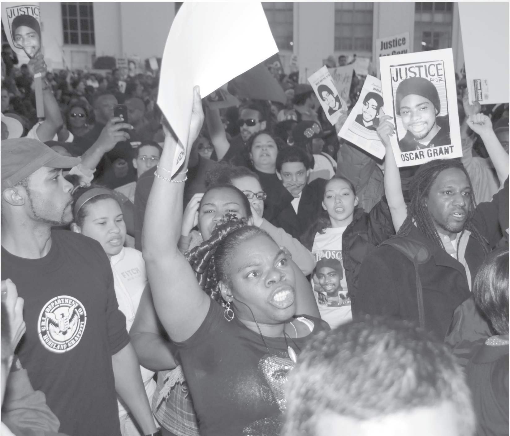
Especial para Revolución

“ Nos toca a nosotros: despertarnos... sacudirnos lo que nos imponen, las formas en que nos tienen pensando para que puedan mantenernos sometidos y atrapados en el mismo ajetreo cotidiano de siempre... levantarnos , como Emancipadores de la Humanidad conscientes. Los días en que este sistema simplemente puede seguir haciendo lo que le hace a la gente en este país y en todo el mundo... en que la gente no tiene la inspiración ni la organización para hacerle frente a estas barbaridades y acumular las fuerzas para poner fin a esta locura... esos días deben TERMINAR. Y esto SE PUEDE hacer. ”