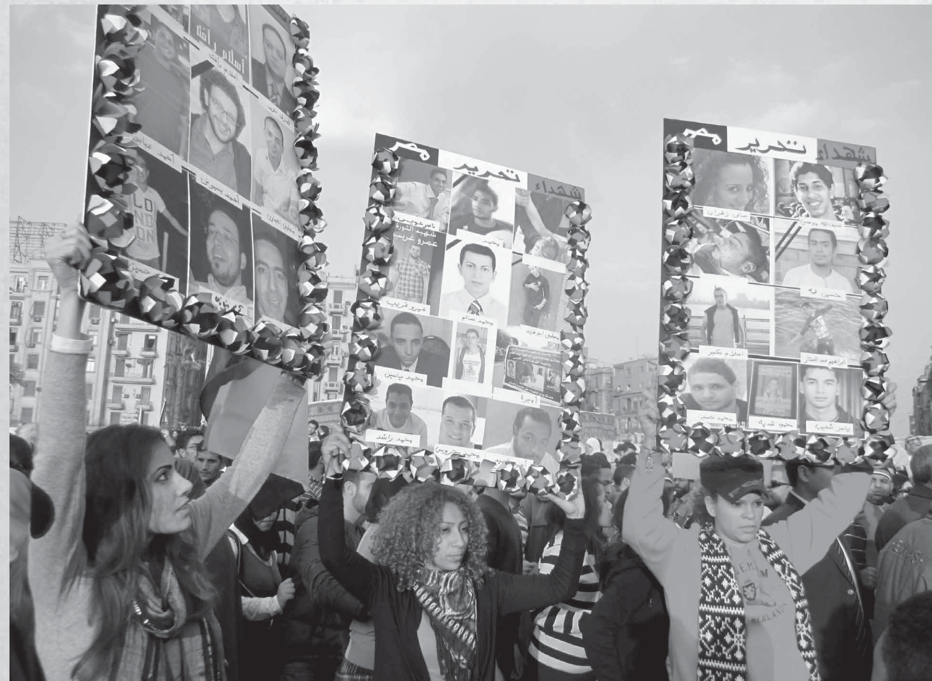
El Cairo, 8 de febrero de 2011: Manifestantes con pancartas con imágenes de las mujeres y hombres asesinados por las fuerzas de seguridad del estado.

Lea el texto completo en árabe, español, inglés y otros idiomas en línea en revcom.us .