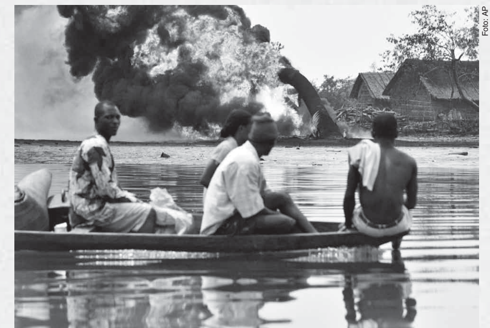
2005, Nigeria: Una evacuación por el incendio de un oleoducto de la cia. Shell Petroleum Development.

A celebrar el 1º de Mayo revolucionario de 2011