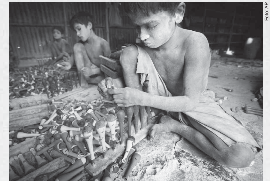
2009, Bangla Desh: Niños trabajan en un taller de globos.