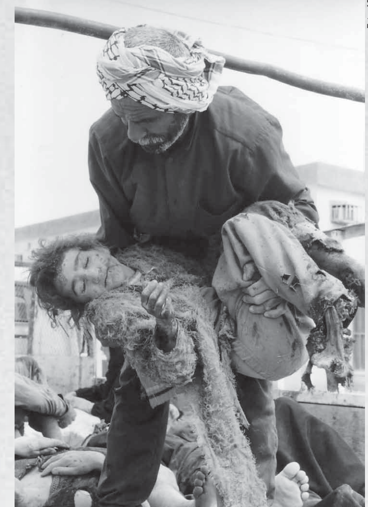
2003, Irak: Una joven lesionada por un ataque aéreo estadounidense contra la ciudad de Basora.