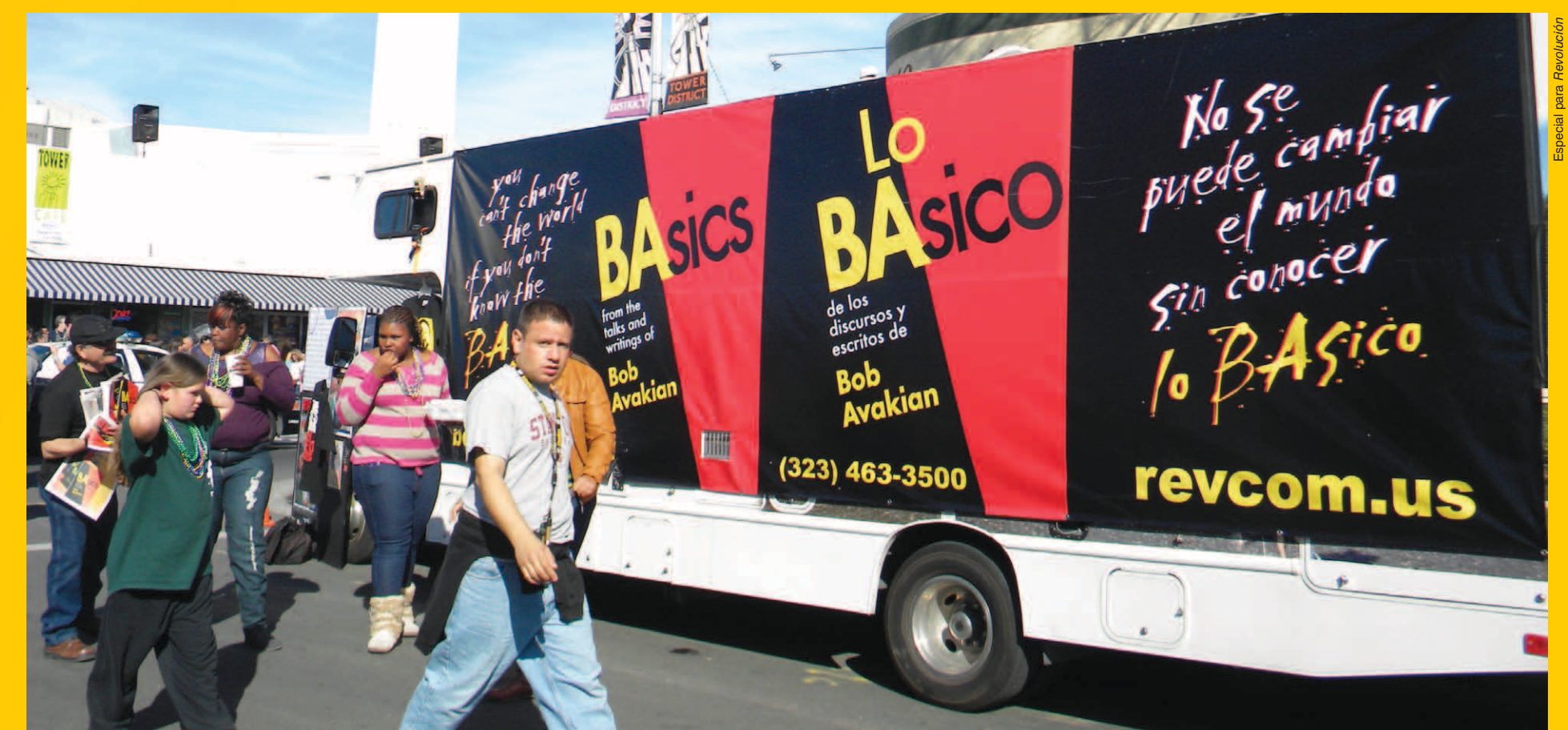
Especial para Revolución

• ¡Ofrezcense de voluntario! Se necesita todo tipo de ayuda, no importa dónde usted viva o las horas que tenga disponibles; puede ayudar en el trabajo mediático y en promociones por internet (ambos se necesitan ahora con urgencia), en la edición de videos (para producir cortos videos de la gira mientras está en marcha), y más. Comuníquese a basicsevent@yahoo.com