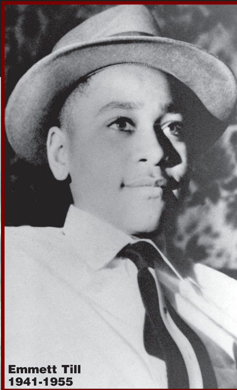
Emmett Till 1941-1955

Una parte de Revolución: por qué es necesaria, por qué es posible, qué es de Bob Avakian