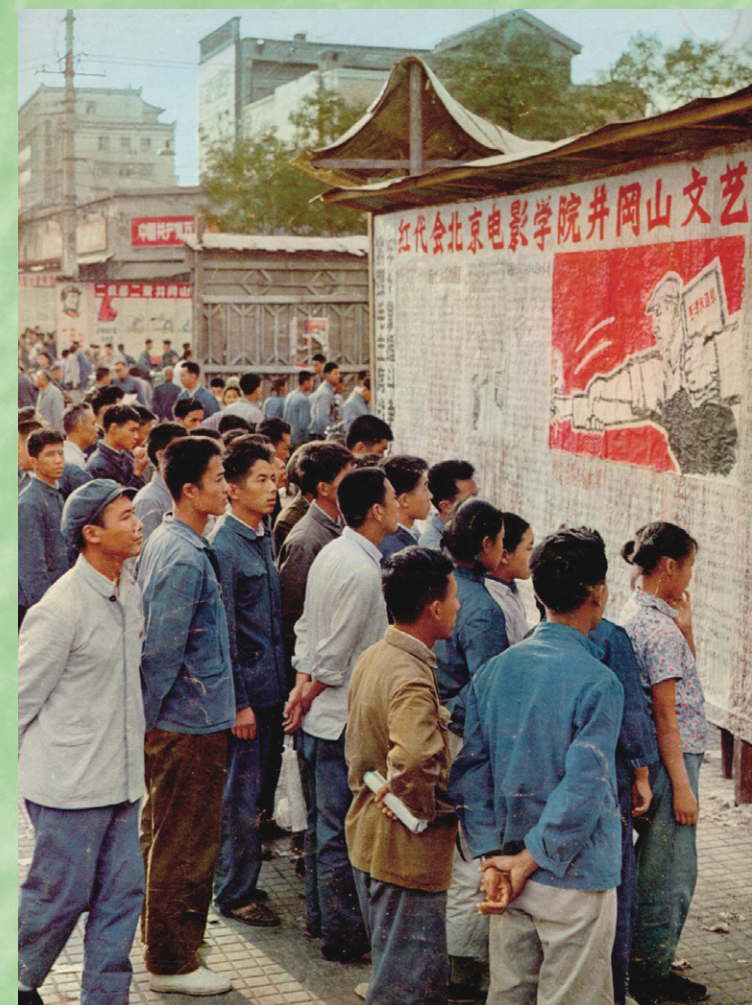
Durante la Revolución Cultural de China de 1966 a 1976, por todas partes los “cartelones de grandes caracteres” cubrieron los muros en los debates sobre las grandes cuestiones en la sociedad.