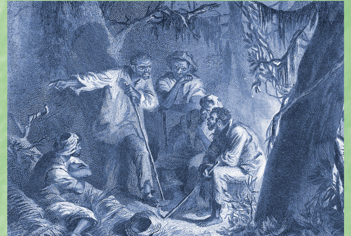
Nat Turner encabezó un levantamiento que sacudió profundamente al sistema de la esclavitud, y de los de arriba se dio una respuesta masiva y brutal.

Después de hacer unos detenidos preparativos, Turner inició la rebelión el 21 de agosto de 1831 con un grupo de otros seis esclavos de confianza. Al comienzo, estaban armados con solamente unos cuantos cuchillos, hachuelas y hachas. Su plan era lanzar un ataque duro y rápido contra los esclavistas y marchar hacia la sede del gobierno del condado, movilizándolo sobre el camino a otros esclavos a favor de su causa. En cierto momento, las fuerzas de Turner llegaron a contar con 80 elementos. El levantamiento sacudió profundamente al sistema de la esclavitud, y de los de arriba se dio una respuesta masiva y brutal. En 48 horas, la rebelión fue derrotada, y antes de rendirse, el propio Turner entró en la clandestinidad por dos meses. El estado ejecutó a Turner y 55 personas más. Las milicias y justicieros de los esclavistas mataron a hasta 200 esclavos más y torturaron a muchos. Durante la rebelión, las fuerzas de Turner mataron a todos los esclavistas con los que se encontraban, no sólo los adultos pero también sus hijos. Pero es importante defender firmemente la Rebelión de Nat Turner (y otras rebeliones de esclavos) y su carácter principal y esencia por ser una justa lucha de los oprimidos en rebelión contra de su opresión.