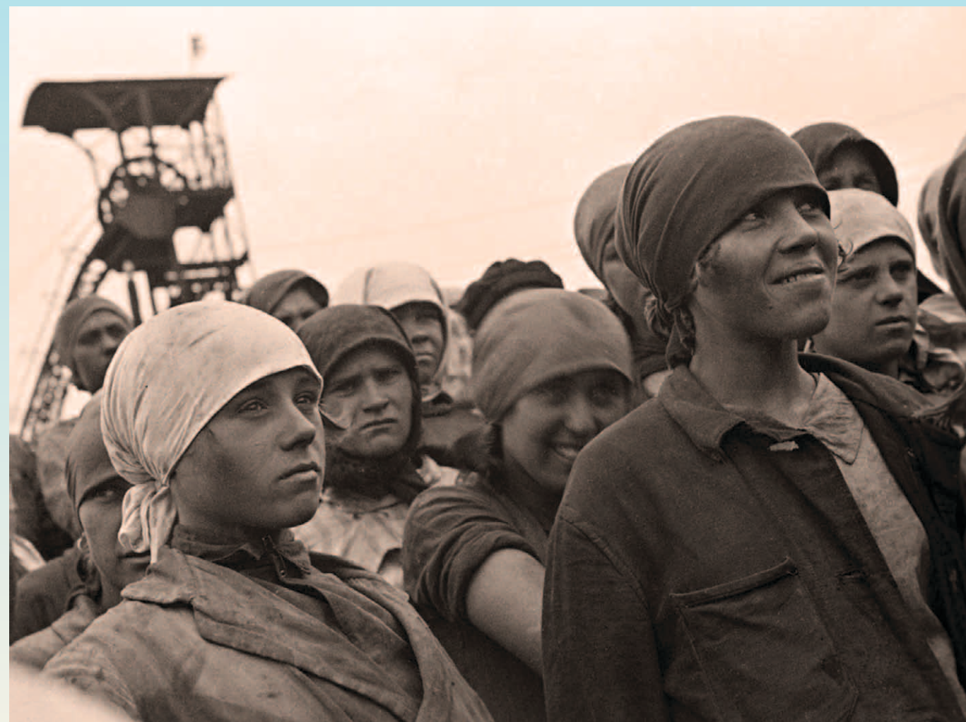
Unión Soviética, 1930: Unas jóvenes mujeres, del grupo de jóvenes comunistas Komsomol, se ofrecen de voluntarias para trabajar en las minas.