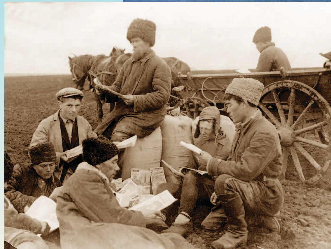
Unión Soviética, 1930: En una campaña para eliminar el analfabetismo entre los campesinos, el gobierno envió millones de libros, periódicos y revistas al campo.