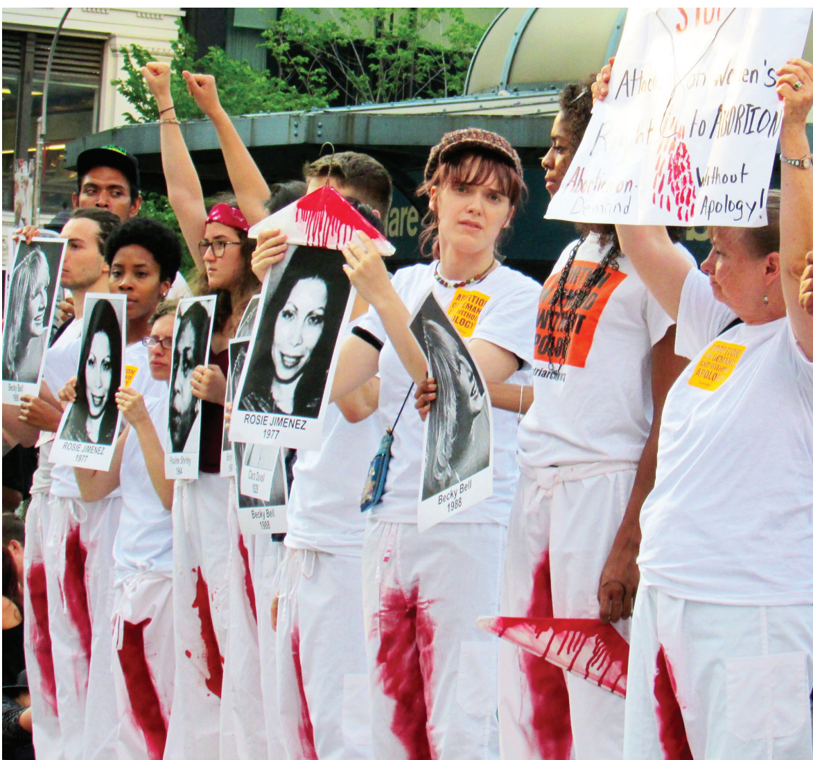
"Pantalones ensangrentados", símbolo de privar a las mujeres del acceso al aborto sin riesgos, Nueva York, 2015.

ABORTO A SOLICITUD Y SIN PEDIR DISCULPAS