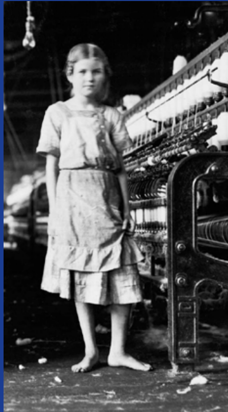
La riqueza de Estados Unidos se forjó por medio de la brutal explotación, incluso a niños, en busca de las ganancias y sin ninguna consideración hacia la vida humana.