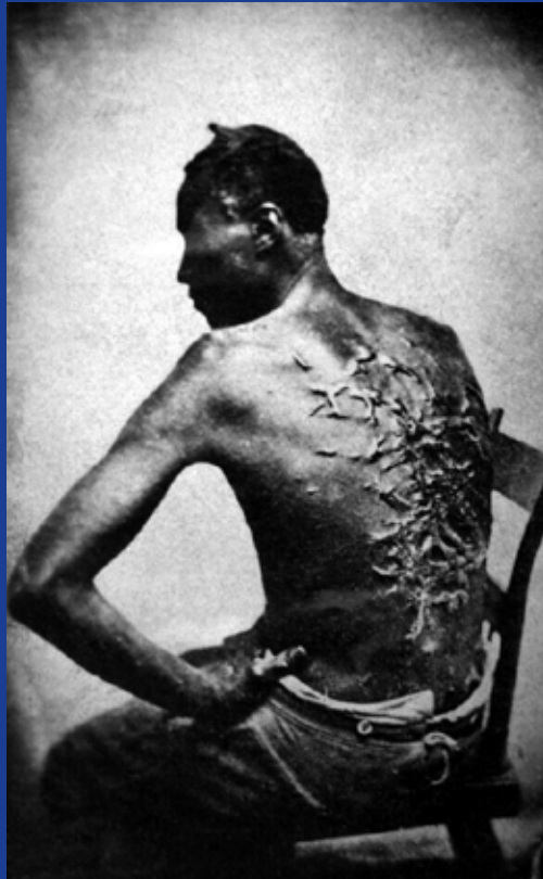
“Sin la esclavitud, Estados Unidos no existiría tal como lo conocemos hoy. Eso es una verdad simple y básica”. (Bob Avakian, Lo Básico 1:1)