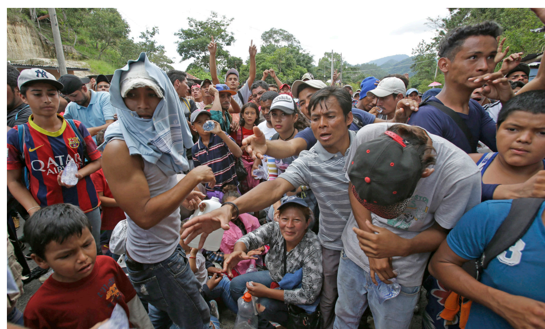
Arribo en Guatemala de una caravana de refugiados que huyen de Honduras, 2018.

El 28 de junio del 2009, el ejército hondureño asestó un golpe de estado al presidente elegido, Manuel Zelaya. Los generales principales al mando del golpe egresaron de la Escuela de las Américas de Estados Unidos, manejada por el ejército yanqui para entrenar a oficiales militares latinoamericanos. Obama, Hillary Clinton y el Departamento de Estado yanqui sabían con anticipación que se preparaba el golpe, y una vez desbancado Zelaya por los generales, emitieron tan sólo unas críticas leves, al que calificaron de una "acción". En cosa de días, Clinton presentó una estrategia para asegurarse de que el golpe prosperara y pudiera adjudicarse legitimidad: se celebrarían elecciones sin permitir la participación de Zelaya. El golpe puso en el poder a un régimen abiertamente fascista y más lacayo de Estados Unidos que hundió al pueblo hondureño aún más en el infierno de la dominación yanqui, asesinatos políticos y terrorismo patrocinados por el estado y una intensificación de la violencia, pobreza y opresión. Éste es uno de los principales factores que han obligado a decenas de miles de América Central a emprender la desesperada travesía hacia Estados Unidos en busca de refugio y medios de sobrevivir.