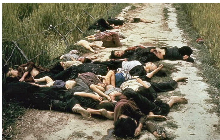
La masacre de My Lai, Vietnam, 1968.