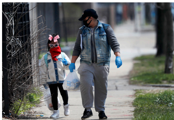
Una mujer con su hija en camino a su casa tras almorzar en una escuela del Barrio Sur, Chicago, 7 de abril.

7. Encubrir el alcance de los daños que se hacen en las comunidades negras, latinas, indígenas y otras comunidades oprimidas más afectadas por la pandemia debido a la supremacía blanca.