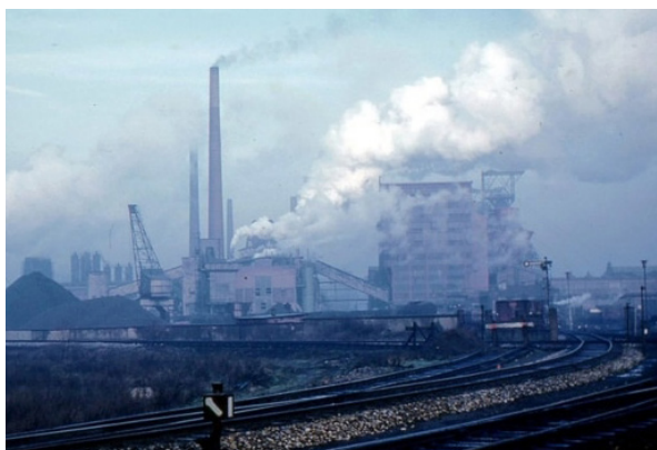
La Agencia de Protección Ambiental de Trump suspende la aplicación de las leyes de protección ambiental, lo que le da a la industria rienda suelta para contaminar. Arriba: central eléctrica vomita humo de carbón.

4. Eviscerar la reglamentación ambiental, acelerar el saqueo de la Tierra por el capitalismo.